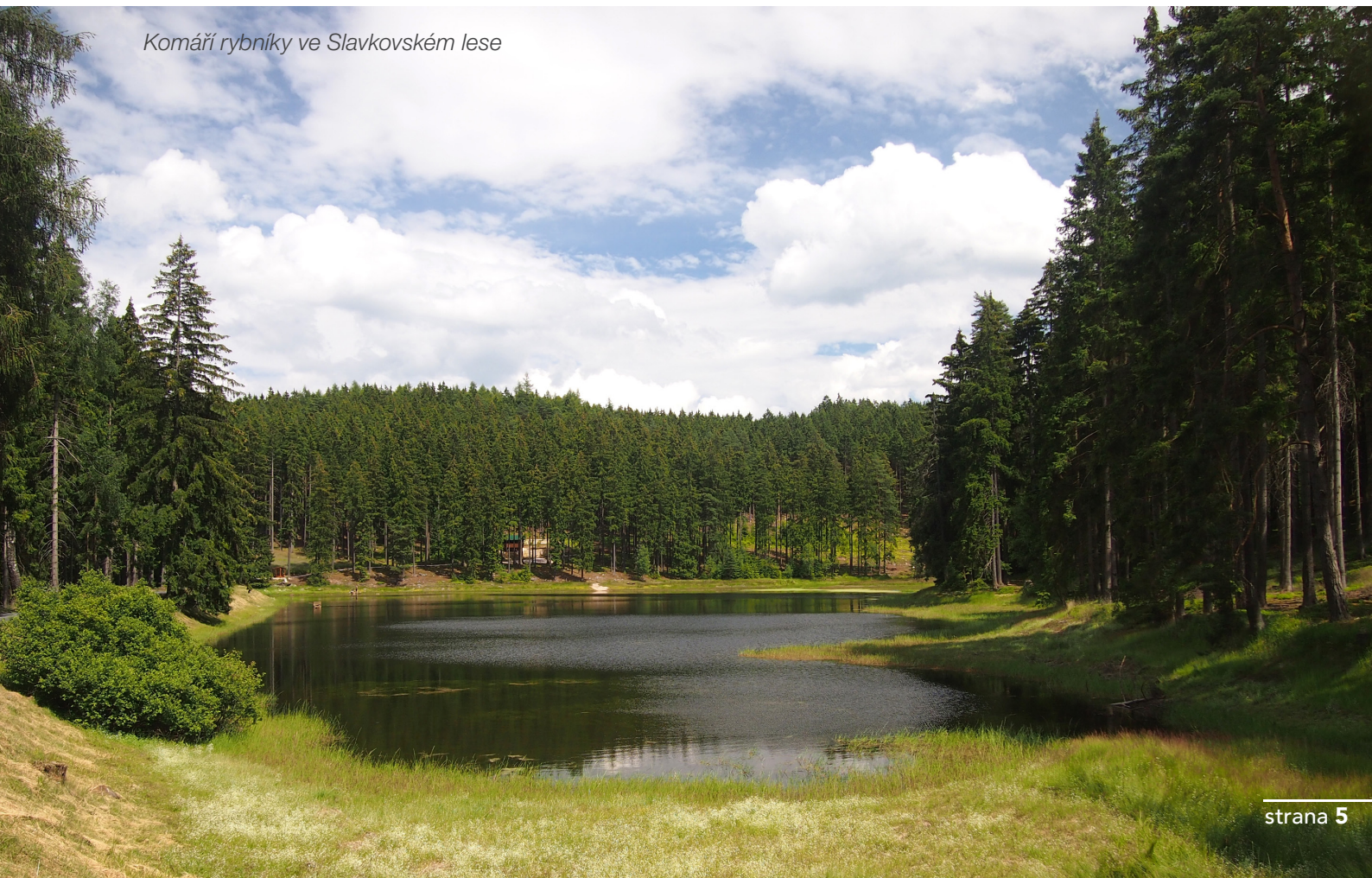
Komáří rybníky ve Slavkovském lese