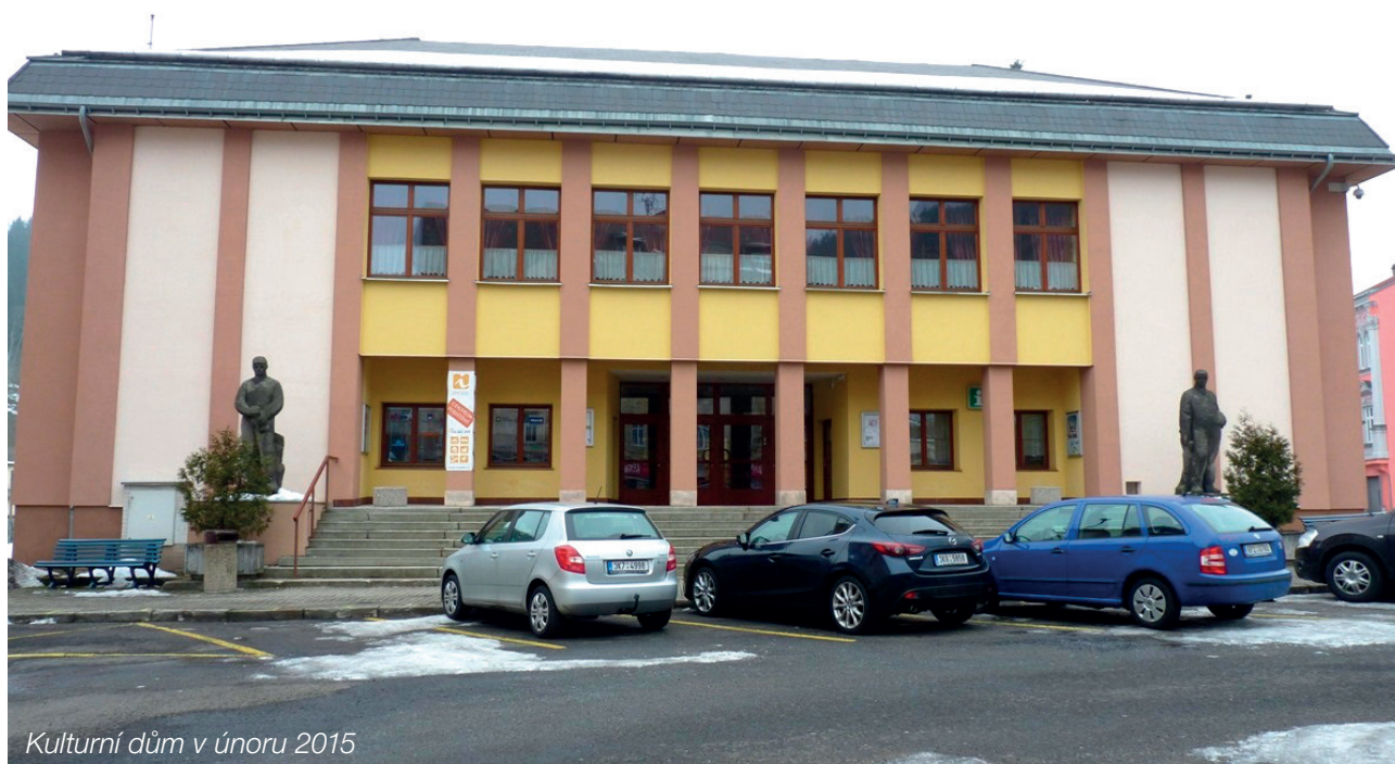
Kulturní dům v únoru 2015

Partneři projektu: Městská knihovna Kraslice, MAS Sokolovsko o.p.s., Svazek měst a obcí Kraslicka, Základní umělecká škola Kraslice, okres Sokolov.